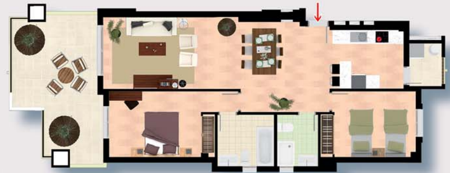
VIVIENDA - 2 HABITACIONES - TIPO A APARTMENT - 2 BEDS - TYPE A