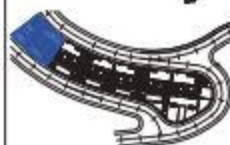
SE PLAN DE SITIO