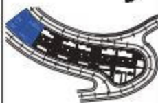
PLANO GROUND FLOOR